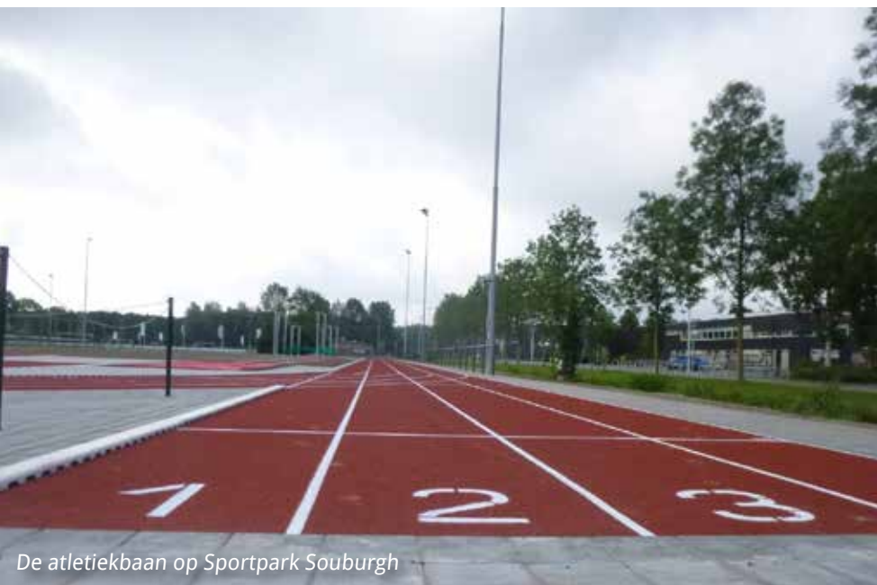
De atletiekbaan op Sportpark Souburgh

Het bestuur van de Gemeenschappelijke Regeling Sportpark (GR) Souburgh heeft een nieuwe samenstelling gekregen.