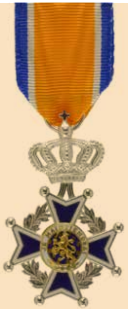
De versierselen die een lid in de Orde van Oranje Nassau mag dragen.

Kent u iemand die zich bijzonder verdienstelijk heeft gemaakt voor de samenleving? Iemand die altijd klaarstaat voor anderen? En dat al jarenlang? Veel verenigingen, instellingen en