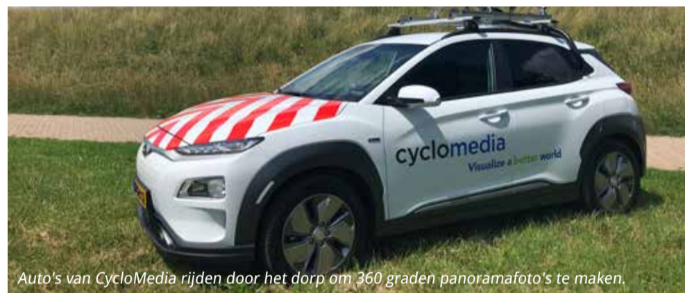
Auto's van CycloMedia rijden door het dorp om 360 graden panoramafoto's te maken.

Voor meer informatie, vragen, verzoeken tot inzage, rectificatie, wissing en beperking van de verwerking of het aantekenen van bezwaar kunt u contact opnemen met CycloMedia Technology B.V., Postbus 2201, 5300 CE Zaltbommel of via privacy@cyclomedia.com .