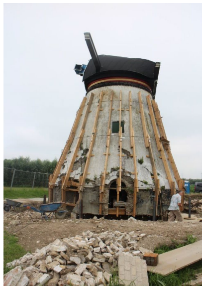
4 juni 2019

Het bestuur bespreekt de vorderingen van de restauratie met de commissie. De werkzaamheden liggen op schema. Nu de fundering gereed is volgt de tweede stap. De molen wordt gevijzeld en waterpas gezet. Getracht wordt het metselwerk nog voor de vorst te restaureren.